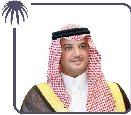
صاحب السمو الملكي الأمير سعود بن طلال بن بدر آل سعود محافظ الأحساء