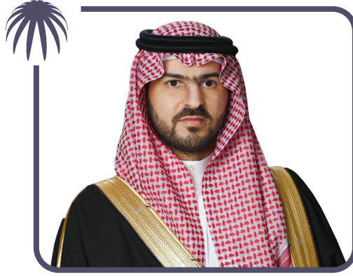
صاحب السمو الملكي الأمير سعود بن بندر بن عبدالعزيز آل سعود نائب أمير المنطقة الشرقية