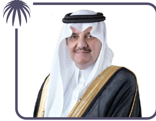
صاحب السمو الملكي الأمير سعود بن نايف بن عبدالعزيز آل سعود أمير المنطقة الشرقية